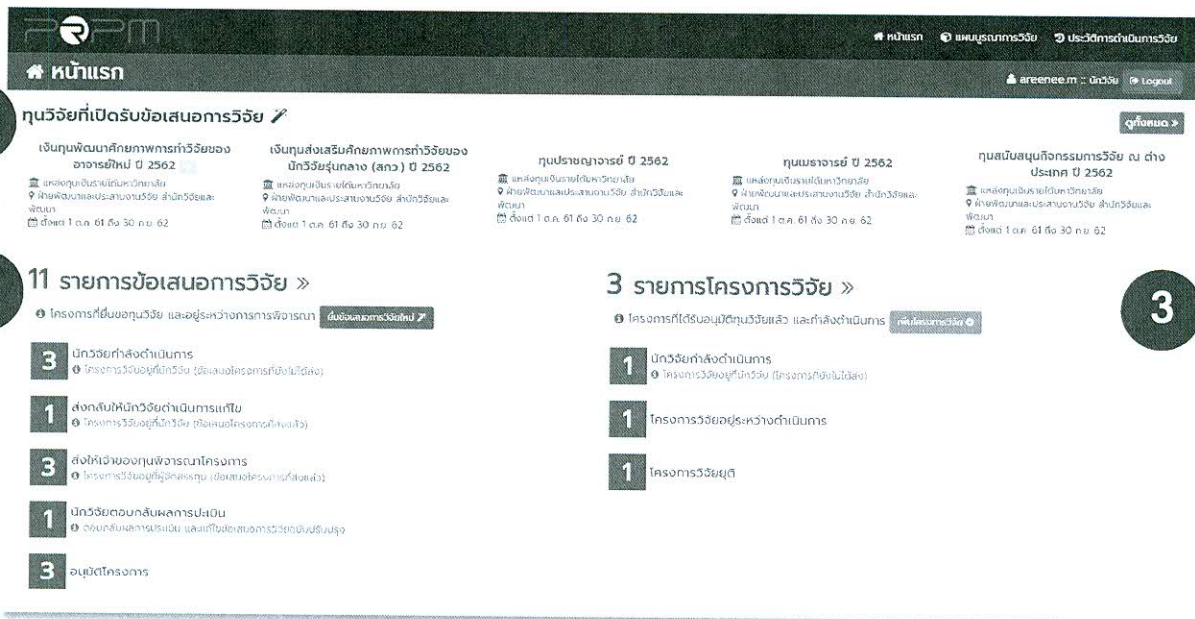
รูปที่ 2 หน้าแรก

เมื่อเข้าสู่ระบบสำเร็จจะปรากฏหน้าแรก ซึ่งประกอบด้วย 3 ส่วน ดังนี้