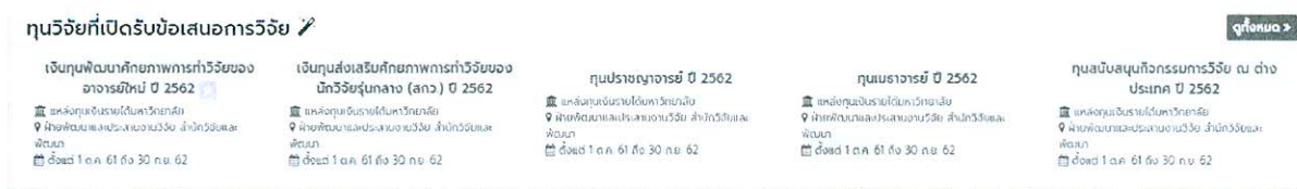
รูปที่ 3 ทุนวิจัยที่เปิดรับข้อเสนอการวิจัย

ระบบจะแสดง ทุนวิจัยกำลังเปิดรับข้อเสนอฯ โดยในหน้าแรกจะแสดง 5 ทุนล่าสุด หากต้องการดูทุนวิจัยทั้งหมดที่กำลังเปิดรับ