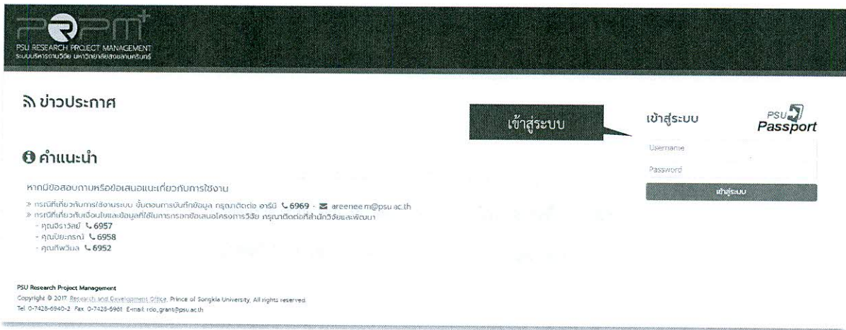
รูปที่ 1 หน้าเข้าสู่ระบบ