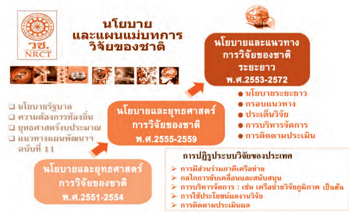
ภาพที่ 1 ความเชื่อมโยงของการพัฒนานโยบายและยุทธศาสตร์การวิจัยของชาติ

นโยบายการวิจัยของชาติดังกล่าวรองรับวิสัยทัศน์การวิจัยของชาติ คือ “ประเทศไทยมีและใช้งานวิจัยที่มีคุณภาพ เพื่อการพัฒนาที่สมดุลและยั่งยืน” โดยมีพันธกิจการวิจัยของชาติ คือ “พัฒนาศักยภาพและขีดความสามารถในการวิจัยของประเทศให้สูงขึ้น และสร้างฐานความรู้ที่มีคุณค่า สามารถประยุกต์และพัฒนาวิทยาการที่เหมาะสมและแพร่หลาย รวมทั้งให้เกิดการเรียนรู้และต่อยอดภูมิปัญญาท้องถิ่น เพื่อให้เกิดประโยชน์เชิงพาณิชย์และสาธารณะ ตลอดจนเกิดการพัฒนาคุณภาพชีวิต โดยใช้ทรัพยากรและเครือข่ายวิจัยอย่างมีประสิทธิภาพ ที่ทุกฝ่ายมีส่วนร่วม”