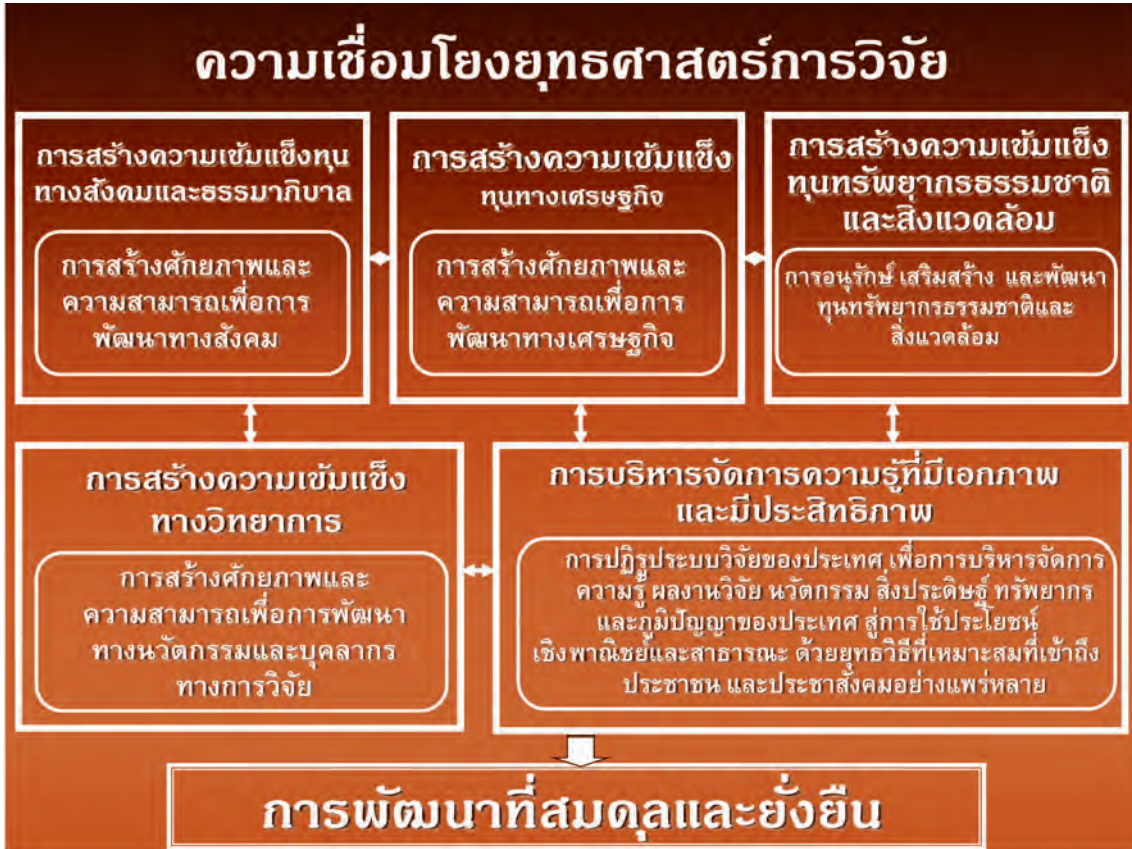
ภาพที่ 3 ความเชื่อมโยงยุทธศาสตร์การวิจัยของชาติสู่เป้าหมายการพัฒนาที่สมดุลและยั่งยืน